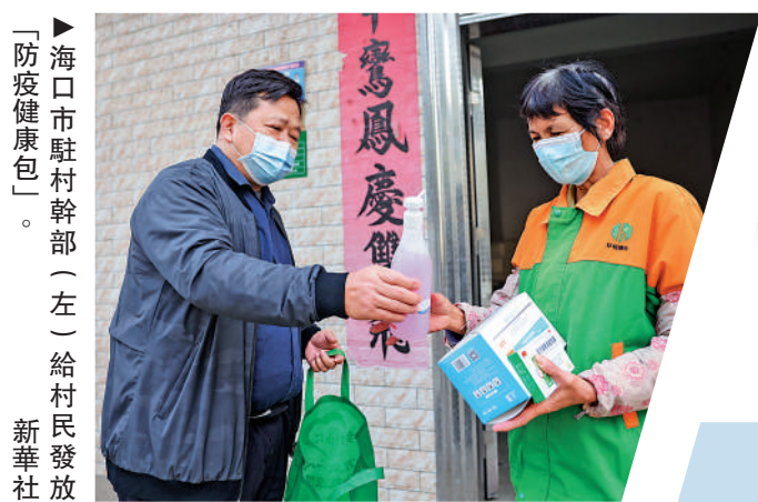
「防疫健康包」。海口市駐村幹部（左）給村民發放。

歲半，香港故宮當時尚在想法創意階段。現在香港故宮已經建成迎客，期待2023年有時間帶任思熠在香港觀摩中華文化藝術精品。」巴慧稱，「數字故宮」讓觀眾實現「身在宮外，心在宮內」，她和女兒任思熠元旦期間在線上已經先熟悉了展品，爲疫情結束前往香港參觀積累知識。「期待帶家人前往西九文化區去看香港故宮，祝福脫離疫情困擾後的東方之珠更璀璨奪目。」大公報記者 張帥