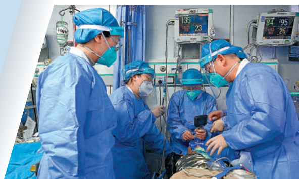
▲西安交大附一院急診科的醫護為病人進行氣管插管。

北京佑安醫院呼吸與感染疾病科主任醫師李侗曾表示，目前XBB毒株的免疫逃逸能力有所增強，但是再次感染主要會發生在一些免疫力低下的人群中，免疫功能正常人群在短時間內再次感染風險比較小，而且感染後的症狀通常比第一次輕微。