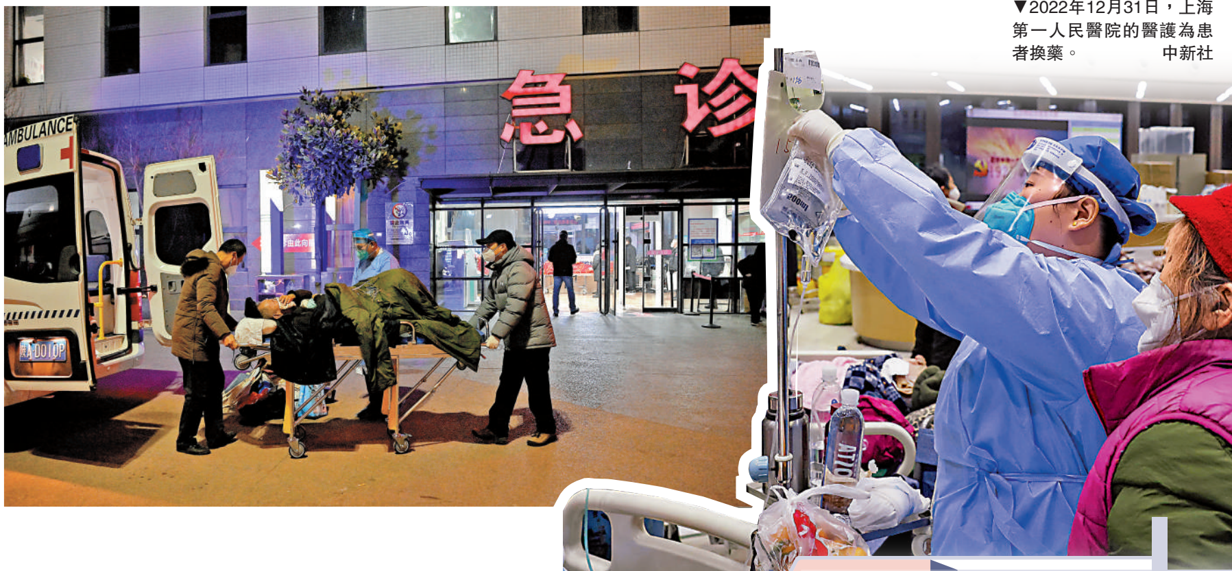
▼2022年12月31日，上海第一人民醫院的醫護為患者換藥。

春節臨近，中國即將迎來城鄉之間人口的大規模流動，勢必會導致新冠病毒的快速傳播，如何應對廣大農村地區的感染高峰，成為巨大的挑戰。焦雅輝表示，應對農村地區的感染主要有兩點，一是要保證藥能夠下去，且供應量要涵蓋春運的時間段甚至還要長；另一個是，一旦有重症患者要能夠轉上來，最起码能夠轉到縣醫院來救治。目前，衛健委已下達指令雙管齊下籌備重症救治。要求縣裏、鄉裏做好車輛準備，一旦發生有病情變化需要轉運，能夠有交通工具把病患盡快轉到縣醫院。各地亦要發揮城鄉醫院對口支援機制，通過城市優質醫療資源對口幫扶縣醫院來應對這一難題。