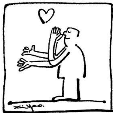
報恩是對記憶的尊重。