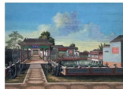
▲紙本水粉《廣州——花園別邸》。

地點：廣東省博物館三層 展期：即日起至3月26日 時間：上午9點至下午5點，逢周一閉館（節假日除外） 費用：免費（需預約）