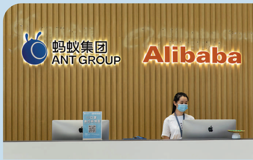
重慶螞蟻消費金融公司增資方案獲批，市場憧憬螞蟻集團已完成整改。

受惠螞蟻消費金融獲准增資，市場認為是釋放正面的信號，阿里系股價顯著飆升，阿里巴巴市觸及96.5港元高位，收報96.4元，炒高8.7%。阿里健康(00241)亦趁機炒上11%，收報7.4港元；阿里影業(01060)更以全日最高0.63港元收市，升5%。