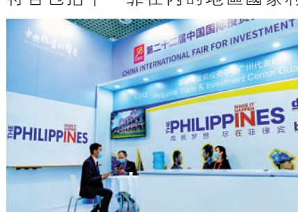
▲在去年9月舉行的第二十二屆中國國際投資貿易洽談會上，參會客商在菲律賓展位洽談。

益。中方願同東盟國家加快推進「南海行為準則」磋商，通過談判解決爭議，維護南海和平穩定。