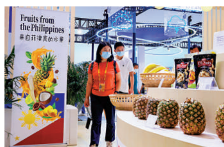
▲在去年9月舉行的中國國際服務貿易交易會上，人們在國家會議中心菲律賓展位參觀。