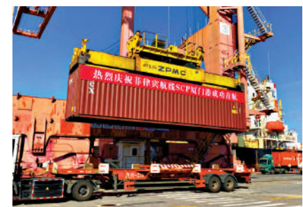
▲1月4日，廈門港2023年首條外貿新航線，廈門港至菲律賓新航線順利開通。

區域與菲律賓的貿易往來更加便利。來自菲律賓的木材、農產品，將可以通過該航線在最短時間內進入中國市場。