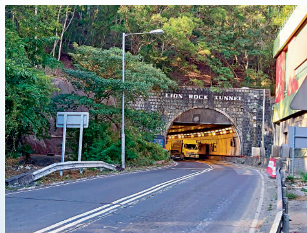
▲運輸署的「易通行」服務將於3月在城門隧道和獅子山隧道（圖）推出。

除車軸貼外，駕駛者可選擇購買以車輛類別劃分的車種貼，一共九款。使用車種貼的人士只能以現金方式為賬戶增值，不能預設繳費方式或將車種貼連結車輛。