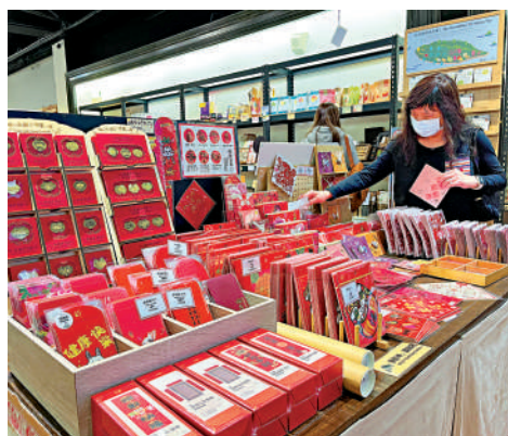
▲1月5日，台北迪化街一家商舖裏，市民在挑選春節紅包。

5日下午，記者走訪了迪化街。不少商戶在抓緊做著裝點、上貨準備，街巷裏已是人頭攢動。商舖張燈結綵，路上重新搭起棚架，店舖裏、騎樓下擺放琳琅滿目的年貨，還有臨時攤位可以「定點試吃」。一位經營乾果零食的林姓商戶表