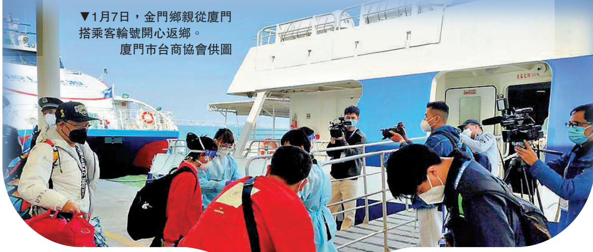
▼1月7日，金門鄉親從廈門搭乘客輪開心返鄉。