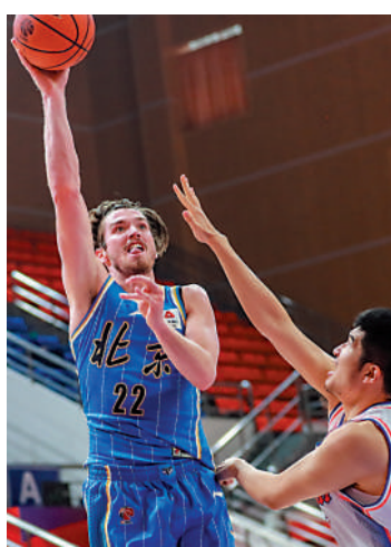
▲北京隊(藍衫)反勝四川，球隊今仗五人得分上雙。

【大公報訊】據新華社報道：2022-2023賽季中國男子籃球職業聯賽(CBA)常規賽第23輪6日開戰，北京隊以91:77大勝末節崩盤的四川隊，遼寧隊以110:98擊敗天津隊取得四連勝。