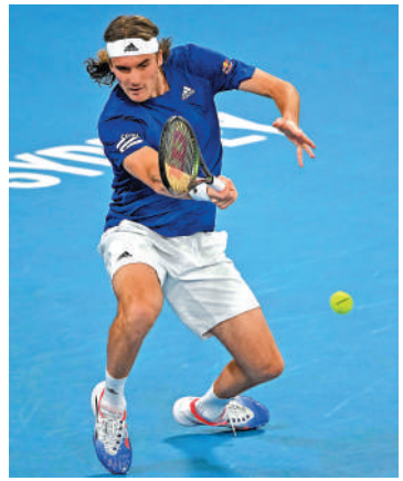
▲西西帕斯雖然男單贏波，惟無助希臘擊敗意大利。

【大公報訊】在澳洲舉行的聯合盃網球賽昨天繼續舉行第2場四強賽事，由希臘與意大利爭入決賽。前天領先總比數2:0的意大利受到希臘反擊，希臘男單好手西西帕斯於第3場賽事以盤數2:1反勝貝列天尼而扳回1:2，但意大利之後在關鍵的第4場女單中取得勝利，領先3:1鎖定勝局，意大利終以4:1擊敗希臘，晉級決賽後將與美國爭奪冠軍。