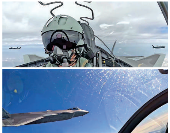
▲數架殲-20戰機在指定空域開展空戰對抗訓練。

進行模擬打擊，精準命中目標，獲得首回合對抗勝利。隨即，紅藍雙方飛行員調整戰機姿態，開始第二輪對抗。