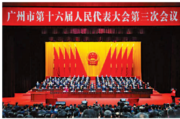
▲1月7日，廣州市第十六屆人民代表大會第三次會議在廣州白雲國際會議中心召開。