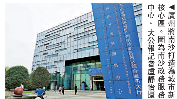
▲廣州南沙科學城。圖為南沙政務服務中心。

新引擎。南沙今年有不少重點項目值得關注。報告透露，今年將加快籌設大灣區國際商業銀行、大灣區保險服務中心、建設大灣區航運聯合交易中心、中國企業「走出去」綜合服務基地。加快香港科技大學（廣州）二期、港式國際化社區、創享灣等平台建设，打造港澳台青年安居樂業新家園。