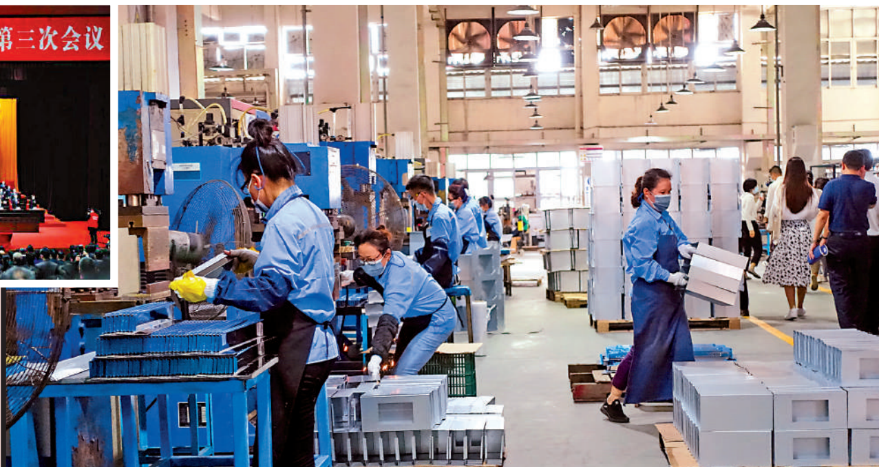
▶廣州今年將「產業第一、製造業立市」放在全年工作首位。圖為廣州一家工廠生產線。

廣州今年如何「拚經濟」？郭永航作政府工作報告時表示，今年廣州將安排市重點項目800個，年度計劃投資3785億元（人民幣，下同），帶動全市固定資產投資增長8%左右，力爭全年投資總量突破1萬億元。此外，郭永航還表示，今年將加快項目開工進度，做到應開盡開、能開早開。把握好時、度、效，優先安排能迅速形成實物工作量和現實生產力的重大項目，力爭基礎設施投資超2500億元、工業投資超1800億元、城市更新投資超2000億元。