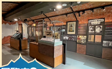
展覽廳8 ▲日軍侵華 攜手抗敵

首個專題展覽廳探討逾百年來英軍與香港政府和社區之間的關係。儘管駐軍與政府偶有矛盾和分歧，但雙方在各領域又通力合作。駐軍看似遠離社會大眾，卻又經常融入民間。專題展覽廳將不定期更換展覽內容，計劃日後可與中國人民解放軍駐香港部隊及其他內地博物館合辦專題展覽，讓參觀者有更多機會深入認識中華文化及相關歷史，亦加強香港與內地的文化交流和聯繫。