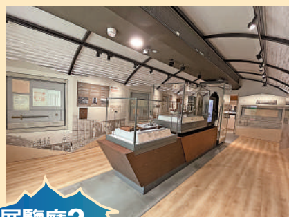
展覽廳2 ▲不平等條約與香港割佔