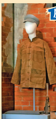
展覽廳10 ▲抗日游擊隊與敵後活動

香港扼守珠江口，是往東南海域必經之地，英軍覬覦香港的海上戰略價值，把香港發展成海軍基地。本展廳將闡述相關歷史背景，並以多媒體展示多艘當年曾長期停泊在維多利亞港內的醫療船和基地船，以及曾到訪香港的著名軍艦。圖為「軍艦訪港」多媒體節目。