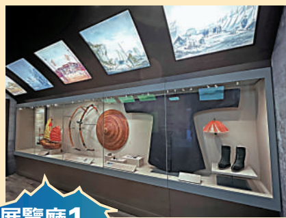
展覽廳1 ▲代防務建置