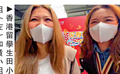
香港留學生田小姐(左)和黃小姐對通關感到興奮。