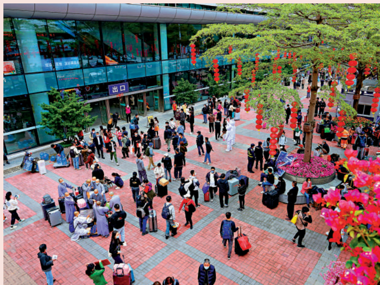
福田口岸終迎來通關，熱鬧重現。