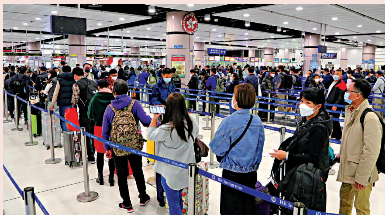
落馬洲管制站昨日重開，過關人流不絕。