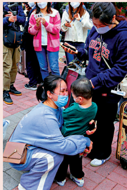
久別重逢，與孩子來個深情擁抱。