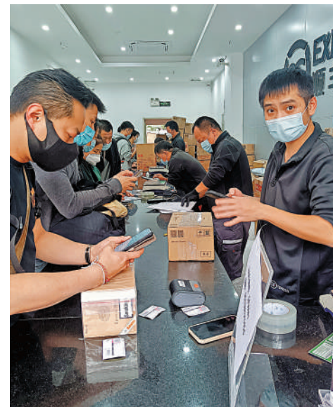
▲大量港人湧入順豐福田口岸店寄快遞，業務員忙得不可開交。