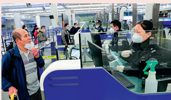
▲旅客凌晨在珠海口岸，順利通關。