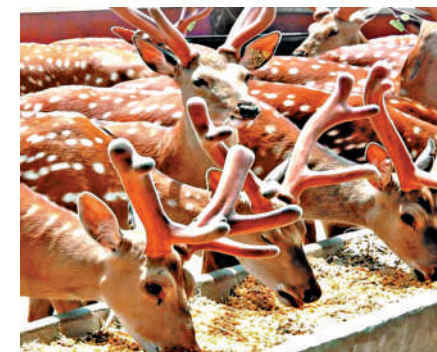
▲ 吉林省的梅花鹿飼養量達60萬隻，佔全國總量一半以上。

涵蓋林下參、沙棘果等21個品種，年銷售收入達5000萬元，解決剩餘勞動力就業200餘人。