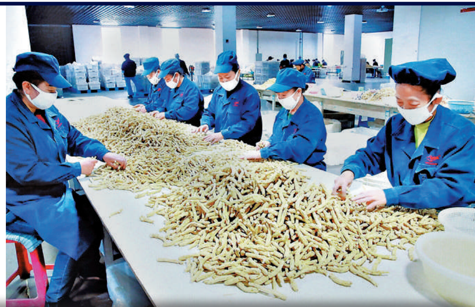
工作人員正按人參大小、年份劃分等級。