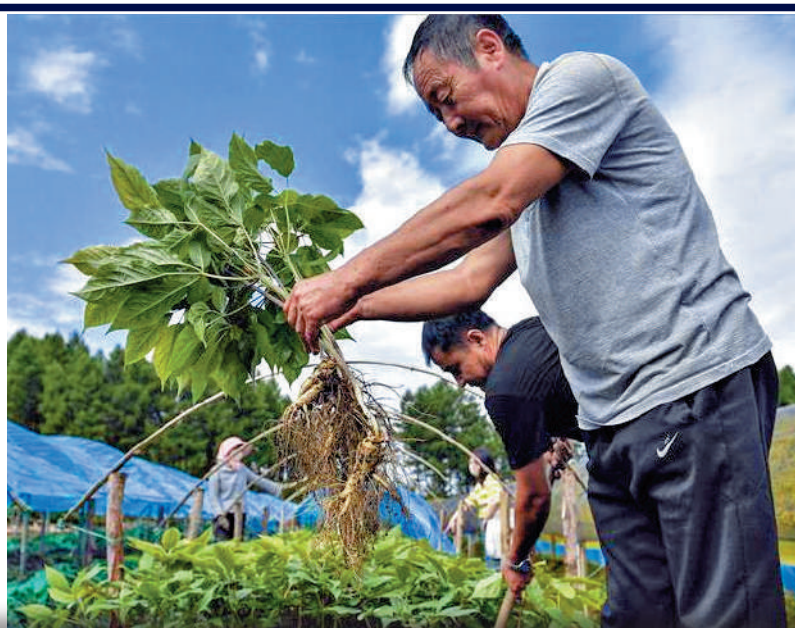
吉林的人參產量在中國排行第一。