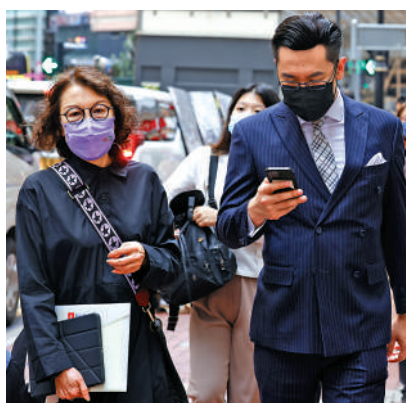
港人關注強積金的收費。

本市場連續兩個月造好下，資金開始回流股票基金。王玉麟表示，2022年全年強積金資金流向達134億元，當中有兩次較大規模資產轉移值得注意。3月份時有高達66億元資產流向股票基金，反映部分強積金成員嘗試「撈底」，這部分成員「撈底」失敗，在往後的4月份至10月份中均持續錄得虧損直到11月份。他續稱，11月份時再次錄得46億元資產流向股票基金，成員再次「撈底」。市場氣氛近期明顯好轉，港股升勢亦持續，相信11月後資金持續流向股票基金。