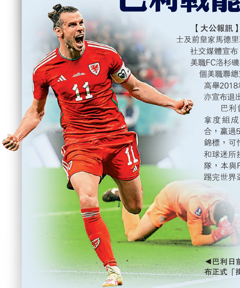
▲巴利日前在網上宣布正式「掛靴」。 資料圖片

另外，破紀錄145次代表法國的熱刺門將洛里斯退出國家隊。36歲的洛里斯曾121次以隊長身份為法國比賽，亦是隊史紀錄，5年前協助法國第2次奪世盃，他退出後，華拉尼和基利安麥比巴成為繼承隊長臂章的熱門。