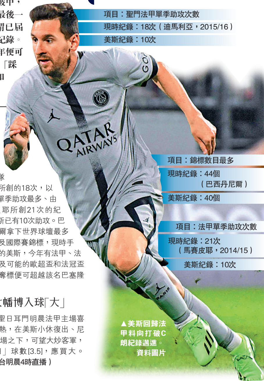
▲美斯回歸法甲料向打破C朗紀錄邁進。 資料圖片

項目：法甲單季助攻次數 現時紀錄：21次(馬賽皮耶, 2014/15) 美斯紀錄：10次