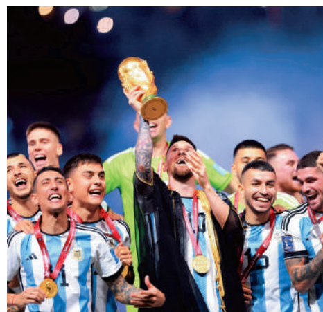
►美斯(舉盃者)終如願奪得世盃錦標。 資料圖片