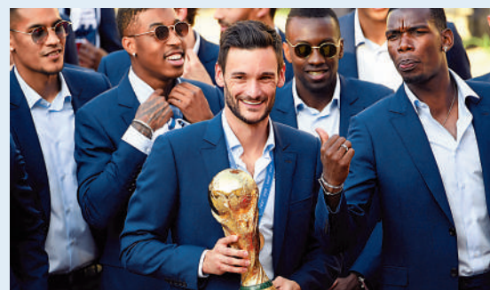
▲洛里斯(中)宣布退出法國隊，專心在英超打拚。