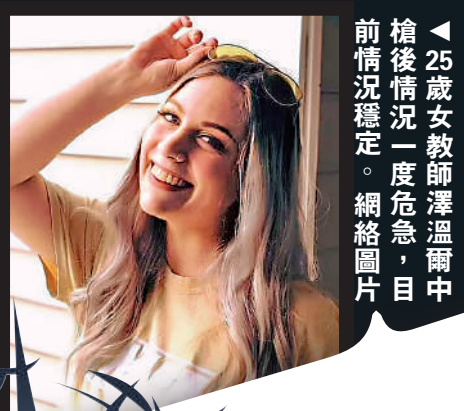
◀ 25歲女教師澤溫爾中槍後情況一度危急，目前情況穩定。