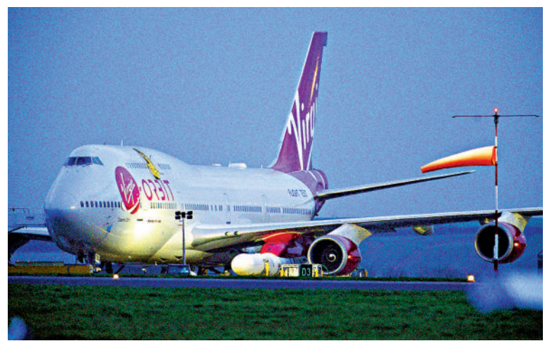
◀ 維珍航空改裝波音747飛機「宇宙女孩」9日搭載着火箭準備起飛。

由英國此前從未在境內將衛星送入軌道，故此衛星發射任務被視為英國航天業的重大突破。英國科學、技術和創新國務大臣弗里曼在當天早些時候表示，伴隨着航天業逐漸由軍用向商用轉變，此次發射對英國「太空經濟」而言是一個好消息。