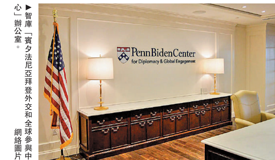
▶ 智庫「賓夕法尼亞拜登外交和全球參與中心」辦公室。

特朗普10日在社交媒體發文稱：「美國聯邦調查局（FBI）何時會突襲拜登的住處，甚至是白宮？這些文件肯定沒有解密。」