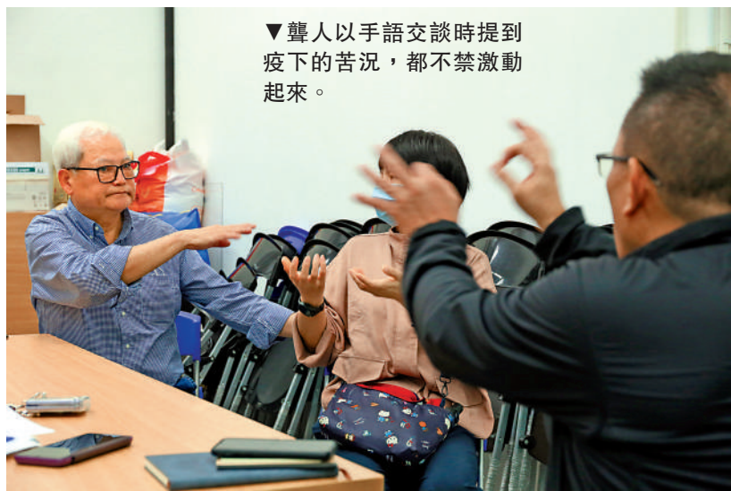
▼聾人以手語交談時提到疫下的苦況，都不禁激動起來。