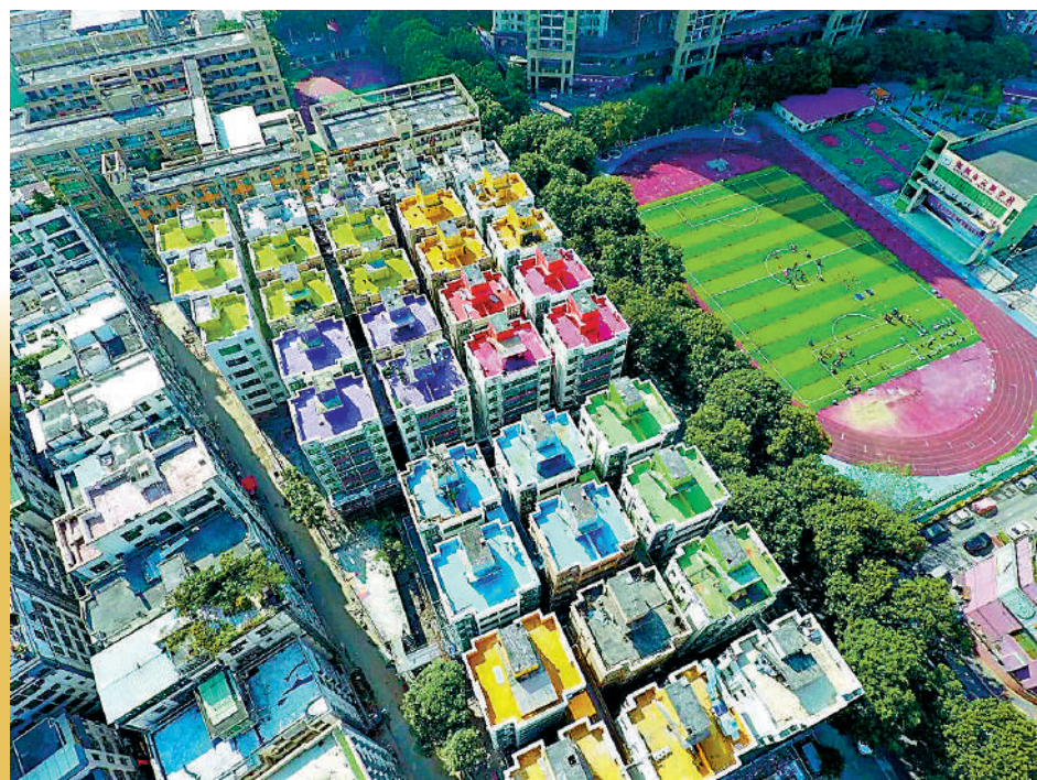
▲1368文化街區的一至二樓為商店，三樓以上便是人才公寓。