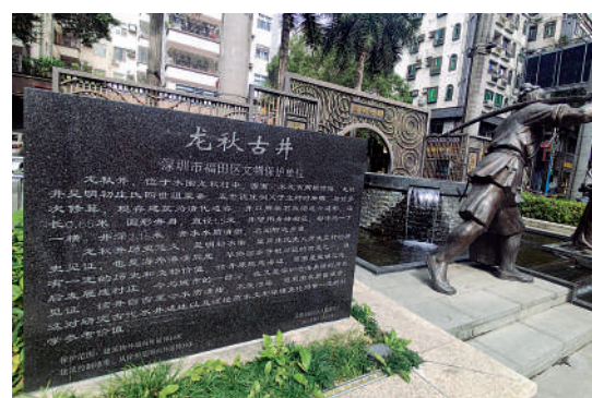
▲龍秋古井建於明朝初年，至今已經有六百多年歷史。

經過30年的磨礪，這一座城中村逐漸蛻變為深圳中心區的一處旺角。商業大廈、現代化住宅小區、文化廣場、博物館、圖書館、消防站、菜市場、大型超市，臨街食肆林立，握手樓拱成狹窄的十字天，展現出水圍村的千姿百態。