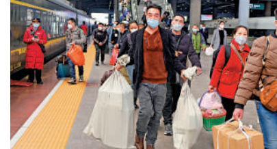
▲2023年春運運輸共40天。圖為1月9日，旅客攜帶「大包小包」踏上回家路。