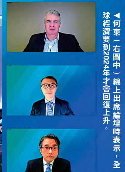
何東（右圖中）線上出席論壇時表示，全球經濟預計2024年才會回復上升。