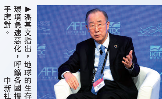
潘基文指出，地球的生存環境正急速惡化，呼籲各國攜手應對。

儘管如此，直至去年全球氣溫已上升1.04度，而在實現2050年碳中和前僅有約0.4度的