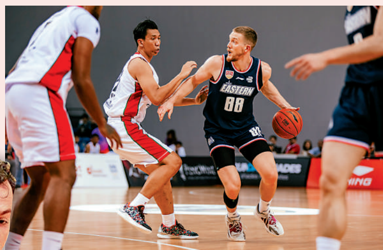
▲基拔（右）發揮出色。