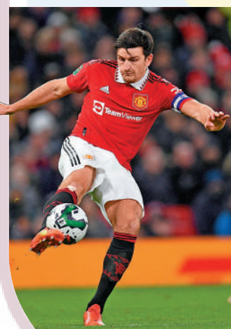
▲馬古尼是艾馬利羅致目標之一。資料圖片