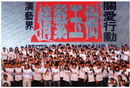
▲2010年4月，港澳台及內地逾300名藝人在香港紅館舉行大匯演，為青海玉樹地震災民籌得善款3506萬港元。

香港特區行政長官李家超在推薦序中指出，本書「從宏觀層面着眼、細微之處入手，多角度展示香港回歸以來在