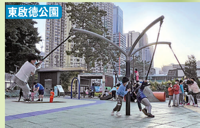
▲在東啟德公園，四名「旋轉吊椅」玩家玩時在空中飛起，隨時可踢中路過的途人。