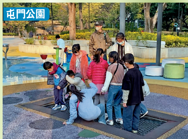
▲屯門公園的跳彈床遊戲深受歡迎，近十名兒童擠在一起彈跳，有人跌倒。