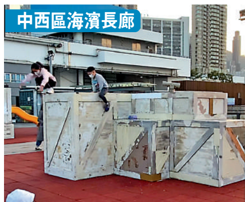
▲中西區海濱長廊內兒童遊樂區，當一堆木箱出現損毀情況。

供兒童游玩的設施除了被指危險，部分更出現日久失修。大公報記者日前查看遊樂場期間，看見不少設施出現損壞。其中青衣公園內一木馬設施的木製腳踏部分已損毀，但未見有圍封或貼上告示，兒童玩時隨時會因此受傷。