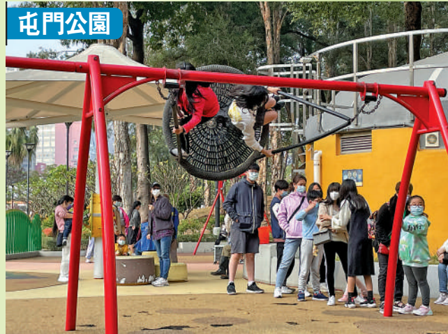
▲屯門公園內的「飛碟鞦韆」衝力奇大，隨時可讓兒童「拋飛」。