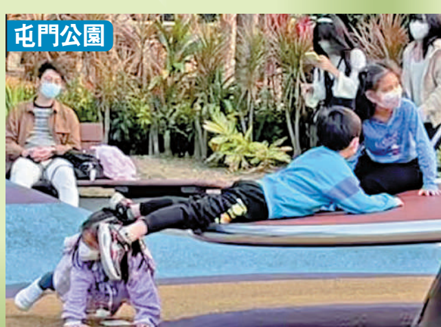
▲在屯門公園兒童遊樂場，男童玩氹氹轉時伸出的雙腿打中旁邊女童的頭部。