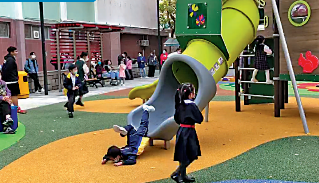
▲新蒲崗崇齡街遊樂場內的「高聳旋轉滑梯」，不少兒童都「大字形」地飛出出口，十分危險。