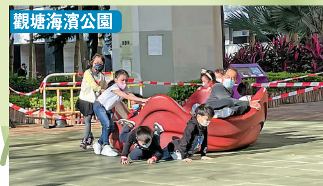
▲觀塘海濱公園的兒童遊樂場內，有一新式「氹氹轉」不時出現「人踏人」事件。