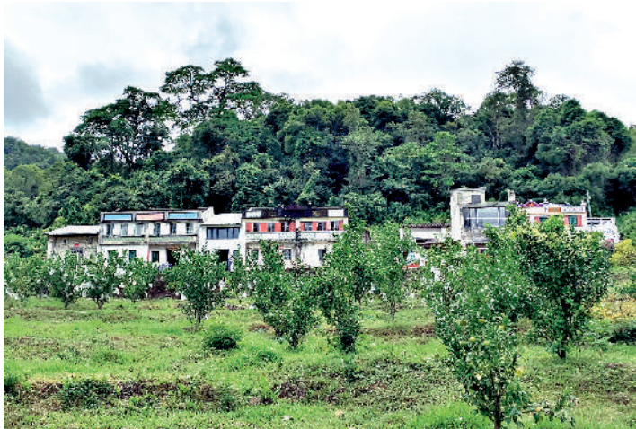
▲梅子林村前種植的桔子樹。

從梅子林離開時恰好是午飯時間，雨也停了，太陽也從陰雲之中透出光來。一路上，陸續看到不少遊客前往荔枝窩，在小瀛故事館內駐足片刻。乘船離開時，能看到不少遊客依次排隊等待。隨着船隻的啟程，荔枝窩在暮色中再次歸於平靜。