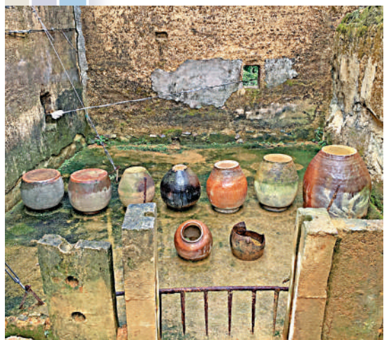
▲老屋檢拾計劃中找到的陶罐。