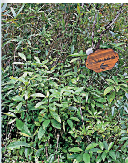
▲從荔枝窩走山路，沿途會有前往梅子林的標識。