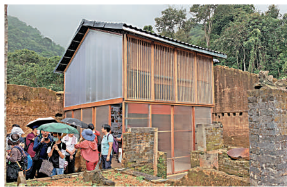
▲遊客排隊參觀梅子林的老屋。

梅子林位於新界東北，被船灣郊野公園包圍，與荔枝窩、三桠、蛤塘等六村同屬沙頭角十約中的慶春約。這片處於山腰的傳統客家村落已有300年的歷史。藉由《梅子林故事：鄉郊文化保育考見記》一書的文化導賞團，記者漫遊梅子林，體驗「山昏兒」中的客家風情。