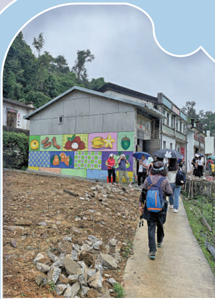
▲村內部分老屋活化，村民與遊客閒聊。