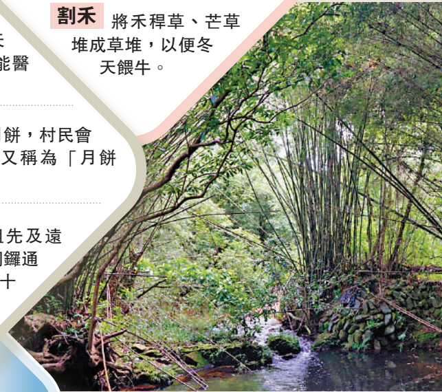
▲苗三古道上的竹林。

在梅子林，仍能看到舊時生活的很多傳統和智慧，如醃製食物。常見有用鹽醃製的薺菜、蘿蔔等。味道濃郁的醃製食物是搭配白米飯的佳品。因蔬菜大多在秋冬時節，醃菜可以確保村民全年都有菜可吃。