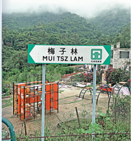
▲梅子林村前陳列着檢拾計劃中收集的村民舊物。