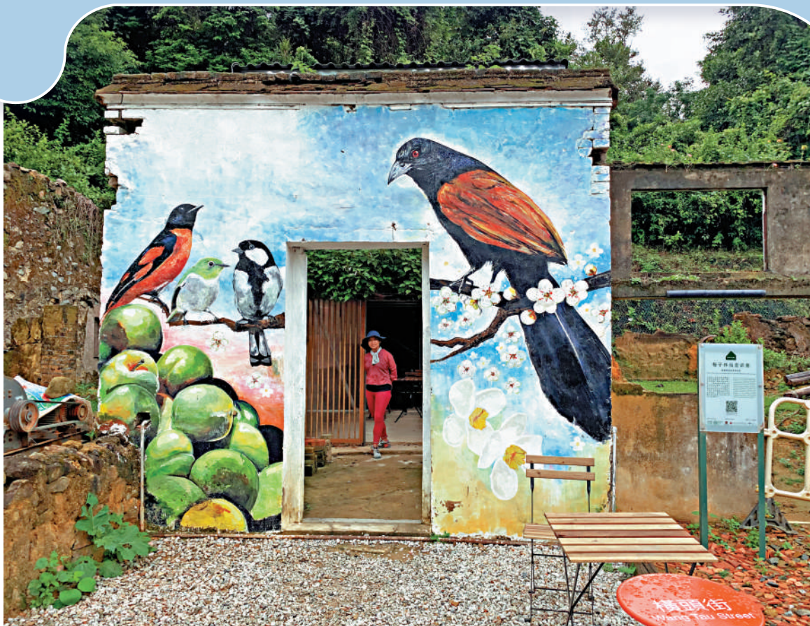
▲村內別有風趣的壁畫。

梅子林位於新界東北，被船灣郊野公園包圍，與荔枝窩、三桠、蛤塘等六村同屬沙頭角十約中的慶春約。這片處於山腰的傳統客家村落已有300年的歷史。藉由《梅子林故事：鄉郊文化保育考見記》一書的文化導賞團，記者漫遊梅子林，體驗「山昏兒」中的客家風情。