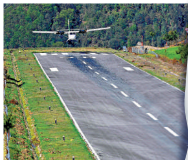
▲跑道盡頭就是懸崖的丹增—希拉瑞機場。

尼泊爾民航局禁止航空公司購買服役時間超過15年的老舊飛機，但為了省錢，一些私人航空公司會選購服役14年左右的飛機。出於安全考慮，歐盟自2013年起禁止所有尼泊爾航空公司的飛機進入其領空。