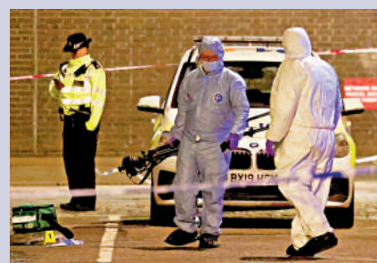
▲倫敦調查人員14日在教堂槍擊案現場工作。