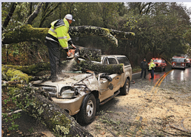
▲加州霍普蘭北部有一架汽車被狂風吹倒的樹木刺穿。

州發生重大災難，批准該州進入緊急狀態，並下令提供聯邦援助。根據Poweroutage.us的數據，14日早上加州有超過6.8萬戶斷電，到15日晚仍