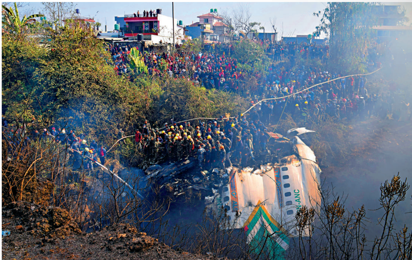
▲尼泊爾一架客機15日墜毀在峽谷中，機上72人無一生還。