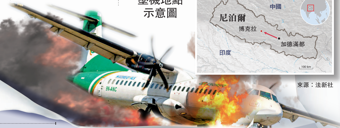
▲墜毀的ATR 72-500飛機機齡長達15年。