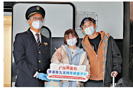
▲赴香港度蜜月的劉女士和丈夫。

別。」劉女士說，這次計劃和丈夫在香港待五天，去體驗香港的遊玩和美食，然後轉機去曼谷開始長途旅行。