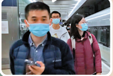
大公報記者盧靜怡、郭若溪、毛麗娟整理