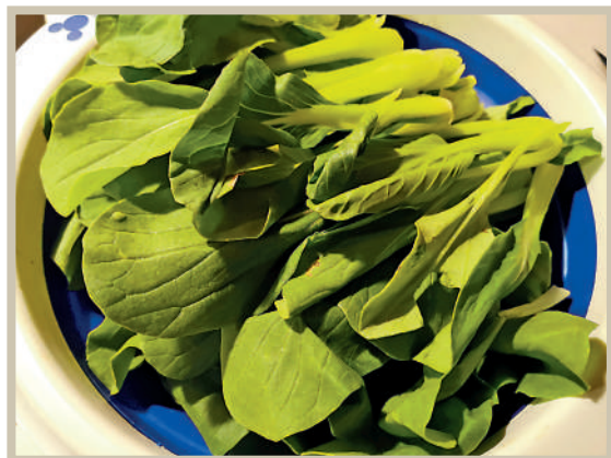
雞毛菜口感清香。

不同於廣東人餐桌上必不可少的那碗滋味濃郁的老火燉湯，在上海甚至更加廣闊的北方地區，最家常的還是蛋花湯，清淡利口又快手。蔥花在油鍋裏爆香，加清水滾開，再下雞毛菜。關火前淋一層薄薄的蛋液，一團團的蛋花就會在沸湯中歡快而熱烈地翻滾綻放，稍加鹹味就大功告成。絲瓜、冬瓜、菠菜、芹菜、小白菜、萵筍葉等等，眾多蔬菜都能用來燒蛋花湯。還可以隨心所欲地加些紫菜、番茄、蝦皮、榨菜之類，各有風味。廣東老火湯一般用於開餐，要以醇厚敦實的香氣打開味蕾和胃口；蛋花湯則是餐後溜溜縫兒的多一口，意在去油解膩，蜻蜓點水才更讓人意猶未盡。