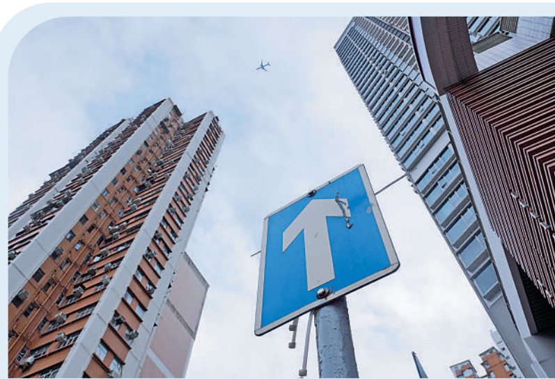
▲本港二手樓交投大升，市場憧憬樓市見底回穩。

滙豐列出最新通關受惠股，包括新秀麗、國泰航空（00293）、九龍倉置業（01997）、數碼通電訊（00315）等股份。新秀麗昨日股價上升4.5%，收報22.2元；國泰上揚2.2%，報8.55元；九倉置業逆市微跌0.1%，報46.95元；數碼通下滑1%，報5.05元。