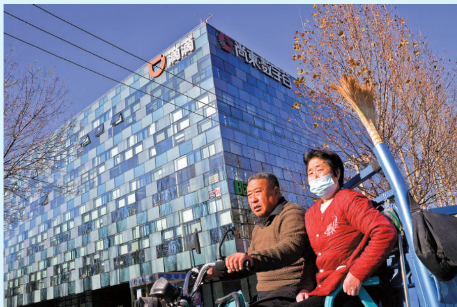
▲分析指出，滴滴出行恢復吸納新客戶後，勢將推出各項補貼計劃搶佔市場份額。