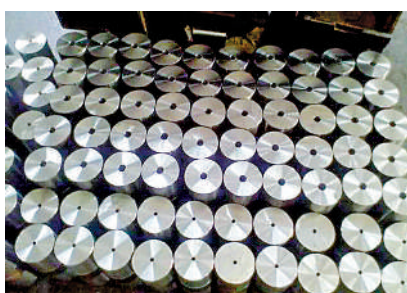
▲▼石墨電極製造商昇能集團將於1月17日掛牌。