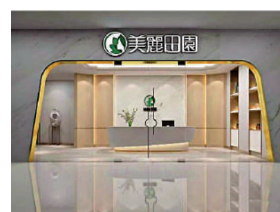
▲美麗田園醫療健康首日掛牌表現佳，散戶每手賺5165元。

至於百果園，聶振邦指出，雖然股價難見升幅，不過分鐘圖顯示持續上行，未知能否守住5.6元的上市價，若今早開市首半小時，未能處於6.2元或以上，考慮止賺離場為佳。若有意進場，待回到5元水平行動，將較具值博率。