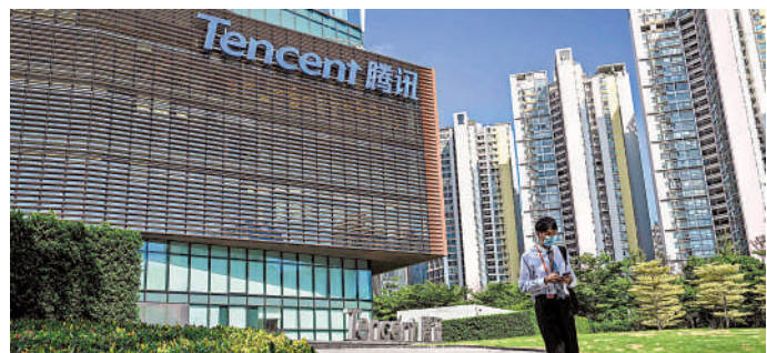
▲騰訊將數位化能力引入到了反舞弊中，在2023年繼續建設這個能力。

馬化騰還表示，騰訊已經將數位化能力也引入了反舞弊中，此後騰訊所有的報銷和外部供應商的數據全部彙集起來，內審內控進行大數據分析，能找到大部分的問題，騰訊會在2023年繼續建設這個能力。