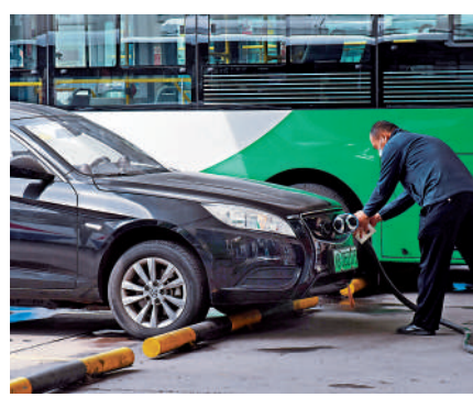
▲去年10月中國網約車市場總訂單達5.74億宗，較9月份升3.6%。

滴滴出行App在市場上消失一年半，競爭對手伺機而動，爭奪滴滴出行的份額，通過不斷燒錢，加碼補貼等措施，吸納新客戶。市場預期，隨着滴滴出行強勢回歸，勢將推出各項補貼計劃以搶攻用戶，內地網約車市場或再掀起新一輪競爭。