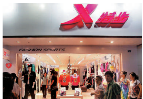
▲特步預計今年店舖平均面積增長約一成。

另外，361度（01361）公布，去年第四季主品牌產品零售額按年大致持平，童裝品牌產品零售額按年錄得低單位數增長。至於電子商務平台產品方面，期內整體流水增長約25%。