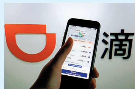
▲去年10月，滴滴出行訂單約有4.18億宗，佔總體市場近73%。