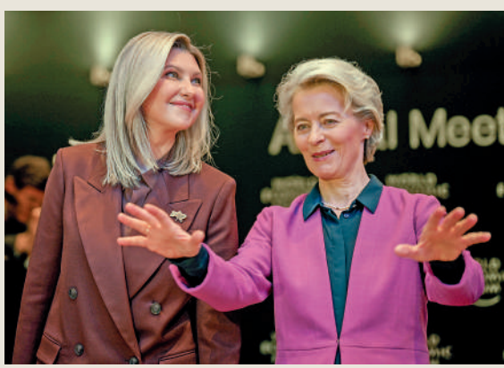
▲烏克蘭第一夫人葉蓮娜（左）17日在達沃斯論壇與歐盟委員會主席馮德萊恩會面。

俄羅斯駐瑞士使館新聞處日前證實，與2022年一樣，俄代表團不會出席今年的達沃斯論壇。瑞士媒體援引世界經濟論壇執行董事的聲明說：「2022年2月（俄烏衝突爆發後），我們決定中斷與俄羅斯