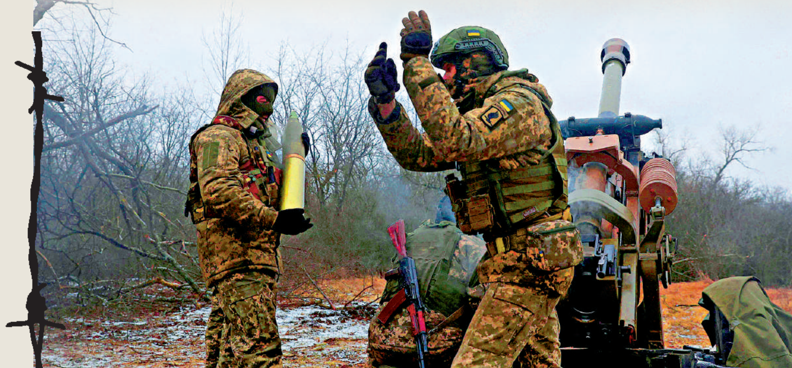
▲烏克蘭士兵16日用英國製造的火炮攻擊俄軍陣地。

15日晚，一批烏克蘭士兵抵達美國俄克拉何馬州，將在美國陸軍防空炮兵學院接受訓練，學習如何使用美國提供的「愛國者」防空系統。同日，美軍開始在德國訓練約500名烏克蘭士兵。