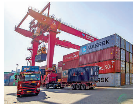
▲1月17日，運輸車輛在江蘇泰州港國際集裝箱堆場轉運集裝箱。

數據顯示，2022年，中國城鎮新增就業1206萬人，超額完成1100萬人的全年預期目標任務。康義稱，受疫情散發多發的影響，內地個別月份城鎮調查失業率出現了階段性上升，調查失業率一度達到6.1%，從全年來看，總體失業率保持基本穩定，尤其是隨着經濟一攬子政策和接續政策落地顯效，近期就業形勢有所改善。康義表示，2023年，就業總量的壓力仍然存在，但隨着經濟好轉，就業需求擴大，崗位會相應增加，就業形勢有望總體改善。