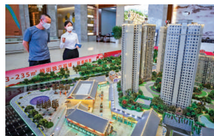
▲貴州市民在售楼处了解樓盤信息。中通社

復旦大學世界經濟研究所所長萬廣華表示，內地經濟恢復向好是必然趨勢，2023年經濟增長有望超過5%。經濟長期恢復的關鍵，取決於各級政府振興消費的政策力度，預測今年3月全國兩會以後，政府能夠出台更多振興消費的政策，補上消費短板。