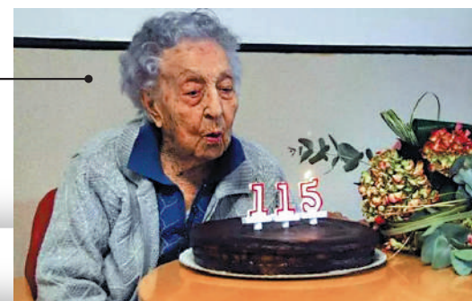
▲目前仍在世的全球最年長人瑞莫雷拉。