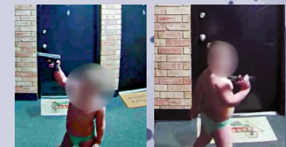
▲美國一名4歲男童近日手持槍支在公寓樓內亂晃。

警方表示，由於奧斯本擁有重罪前科，未來可能面臨更多指控。比奇格羅夫市長巴克利16日發布聲明，表示「和你們所有人一樣，我對所發生的事情感到羞愧，我很感激沒有人受傷，特別是那個幼童」。