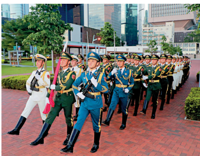
▲駐港解放軍部隊致函香港特別行政區全體市民，恭祝大家幸福安康、闔家團圓。

駐港部隊表示，2022年是香港回歸祖國25周年，中共中央總書記、國家主席、中央軍委主席習近平親臨香港視察，為「一國兩制」偉大事業行穩致遠指明航向，為香港開創新局面、實現新飛躍注入堅定信心和強大力量。新一屆特區政府成立以來，行政長官李家超帶領團隊勇於擔當、務實有為，團結社會各界，堅決維護國家安全，大力恢復經濟活力，積極回應民眾關切，同心合力譜寫新篇章；廣大市民和衷