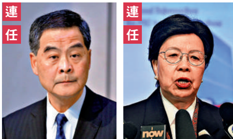
連任 全國政協副主席 梁振英 連任 全國政協常委 陳馮富珍