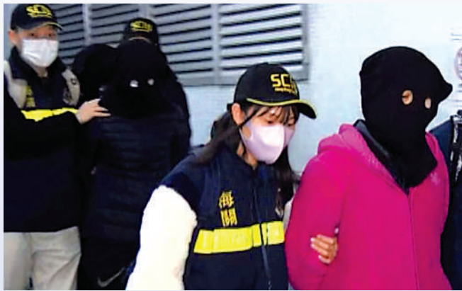
▲海關本月5日採取代號「蜂網」行動，在紅磡黃埔花園等地區拘捕9人。