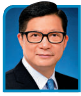
高官論壇 鄧炳強 保安局局長

立法及執法、預防教育及宣傳、戒毒治療及康復服務、研究及對外合作五大範疇着手。當中包括將大麻二酚 (即CBD) 從今年二月一日起按照法例列為毒品管制，以保障市民健康。若市民仍持有任何CBD產品，應盡早棄置，以免違反法例。為方便市民，政府已在10個政府場地安排棄置箱，以供市民在1月30日或之前自願棄置CBD產品。詳情可瀏覽禁毒處的專題網頁 (nd.gov.hk/cbd)。