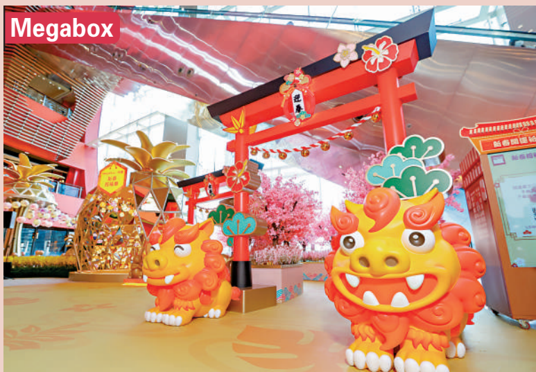
▲Megabox商場內擺放了兩隻祈願招福獅，與顧客一起迎接兔年。