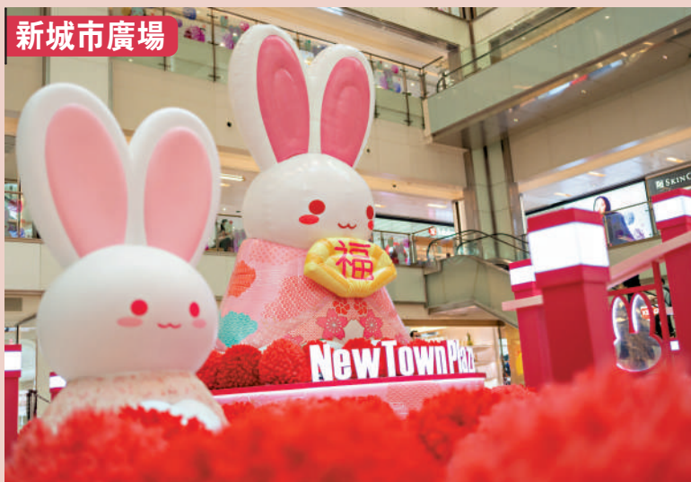
▲新城市廣場將向訪港旅客提供5萬份1000元的購物券禮包。