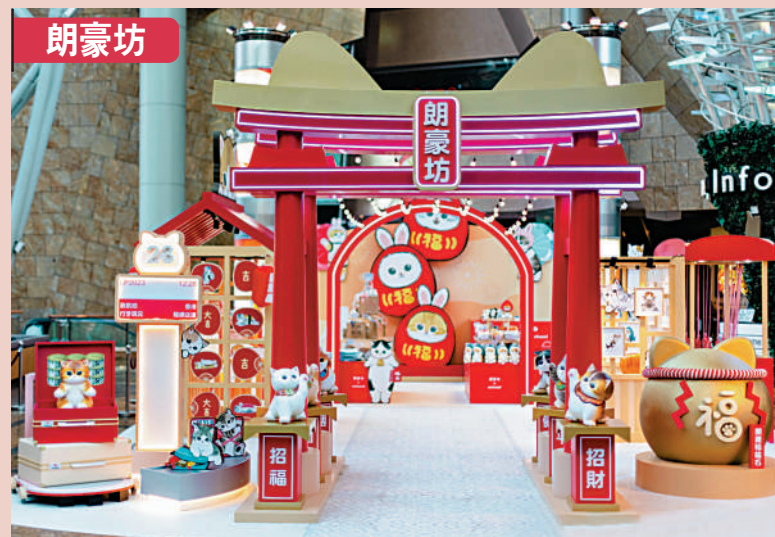
▲朗豪坊食肆推出100%回贈獎賞，以美食吸引旅客到訪。