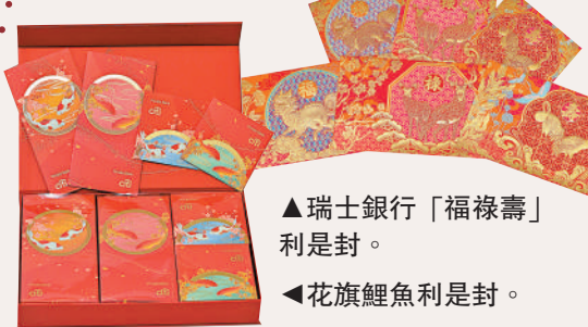
▲瑞士銀行「福祿壽」利是封。 ▲花旗鯉魚利是封。

【大公報訊】香港一向是「炒賣天堂」。只要有市場，基本香港人什麼都可以拿來炒。近年利是封設計愈趨新穎，設計亦充滿特色，是以在二手買賣平台亦有市有價。例如滙豐私人銀行「鯉躍龍門」利是封套裝標價高見3888元；瑞士銀行「福祿壽」利是封套裝叫價2000元；瑞士寶盛銀行「仙鶴孔雀」利是封套裝亦開價1688元。中國人講求意頭，正所謂年年有餘，可以發現貴價利是封出鏡最高的鯉魚設計。