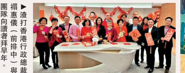
團 ▶ 渣打香港行政總裁向讀者拜早年。