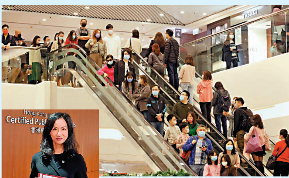
▲會計師公會不建議派消費券，只希望把金錢花在需要的地方，以達至更長遠效果。

再者，為鼓勵在職人士及早為退休儲蓄，該會建議將個人強積金計劃的自願性供款的可扣稅上限，由每年6萬元提高至10萬元，連同取消強積金「對沖」安排，長遠將有助減輕社會福利基金的負擔。另因近期電價上漲，該會建議政府向有需要的市民提供電費補貼，並與推廣節能的措施相結合。