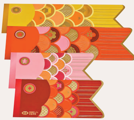
▲滙豐保險鯉魚利是封。