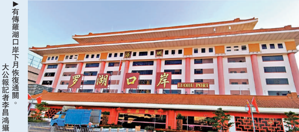
▶有傳羅湖口岸下月恢復通關。