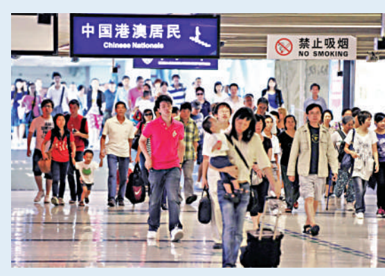
▲疫情前羅湖口岸是港人出入境深圳的主要途徑。資料圖片