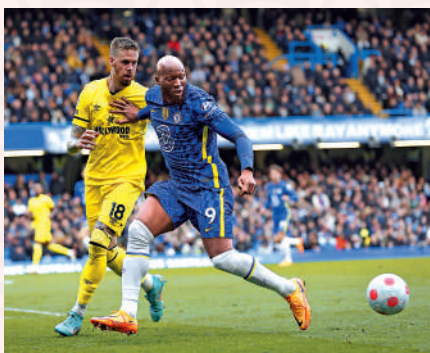
路士後表現不理想。