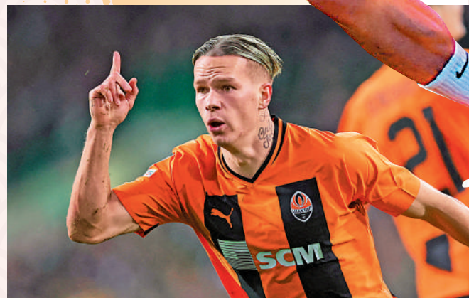
▲梅迪歷在薩克達表現相當出色。