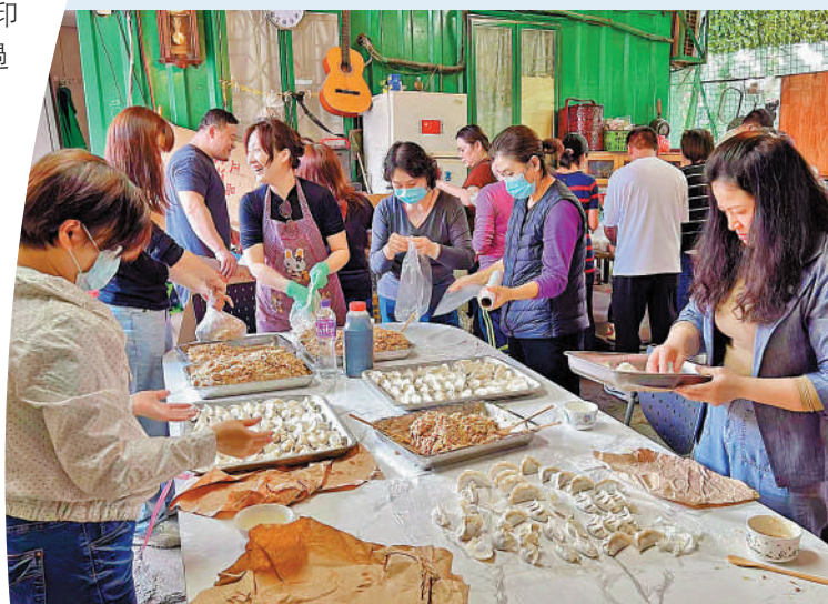
▲「眾望誠」義工在為基層市民及露宿者包餃子。

新春祝福 在春節來臨前，有義工團體為基層市民及露宿者派發手包餃子、水果、口罩等物資，希望為基層市民送上關注及祝福。