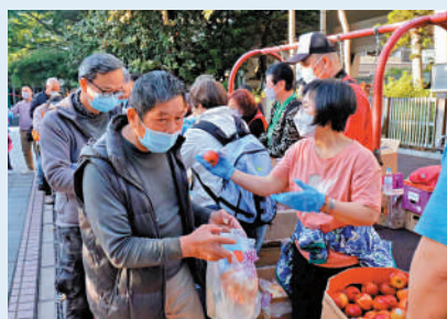
►深水埗基層市民排隊領取各種物資。

義工團體眾望誠聯會近50名義工，在年廿三（14日）到深水埗通州街公園為基層市民及露宿者派發