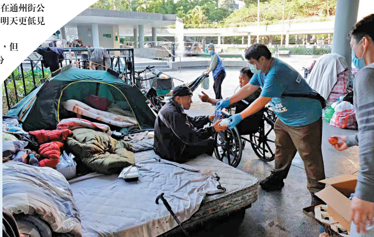
►義工團體「眾望誠」上星期到深水埗通州街公園，派發手包餃子、水果等防疫物資予露宿者。

政府有資助社福機構為露宿者提供宿位，不過，財哥對這些住宿印象不佳，「以前也住過露宿者宿舍，裏面比街上還髒，蛇蟲鼠蟻什麼都有，幾個人一起住，有一個人從來不沖廁所的……」財哥希望，政府或一些企業，能夠給露宿者機會重投社會的機會，「肯定不是每一個（露宿者）都想改過自新的，但萬一有一兩個，都希望能有機會。」財哥看看住的帳篷，「從這裏走出去吧。」