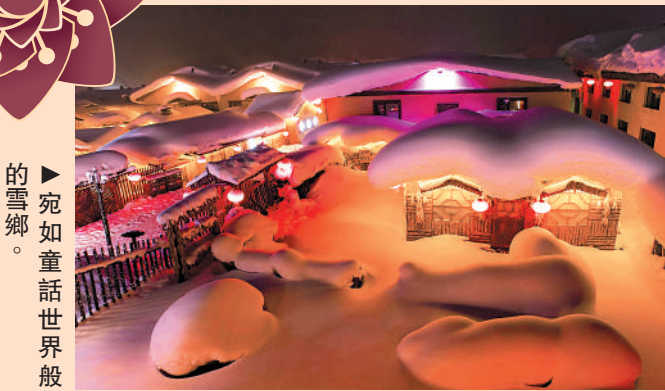
►宛如童話世界般的雪鄉。

承擔了全國80%以上寒區汽車測試工作量的黑河市也找到新機遇。據悉，在建的黑河寒區試車高新技術產業園以申請國家汽車低溫試驗與檢測標準為目標，以中國（黑龍江）自由貿易試驗區黑河片區為依託打造產業平台，構建國際寒區試車產業園，將形成路譜最全面、設施最先進、功能最完善的亞洲最大的寒區試車基地。