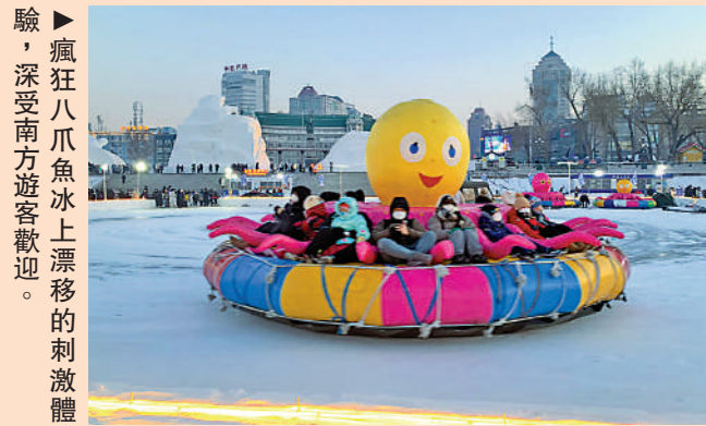
►瘋狂八爪魚冰上漂移的刺激體驗，深受南方遊客歡迎。