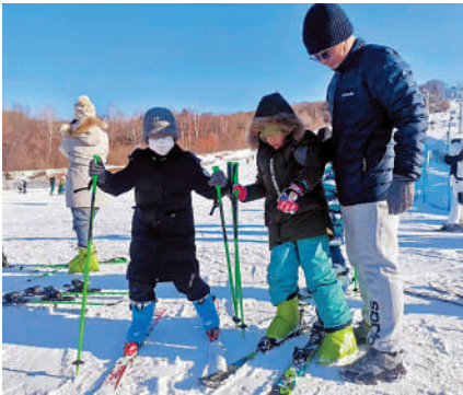
▲兒童體驗滑雪樂趣。

松花江冰雪嘉年華作為去年12月上旬第九屆全國大眾冰雪季啟動儀式場地之一，組織開展了雪地足球、雪地排球、冰上、冰盤等14項群眾喜聞樂見的冰雪運動體驗項目，還舉辦了行程2.5公里、15個障礙項目的冰雪探索之旅。200米冰滑梯、150米雪滑