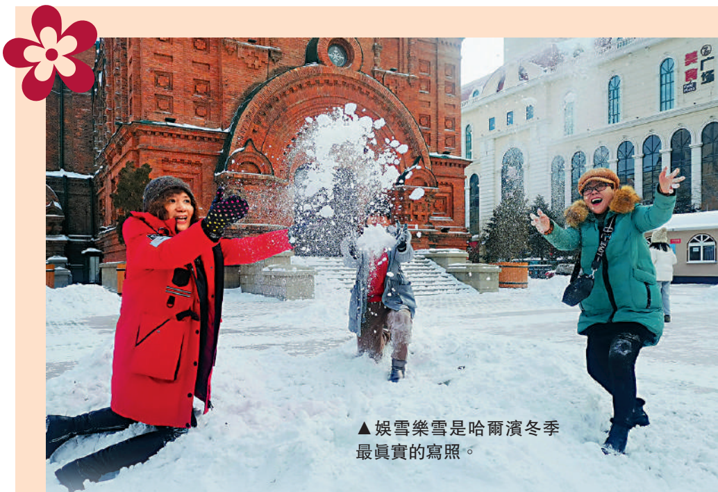
▲娛雪樂雪是哈爾濱冬季最真實的寫照。