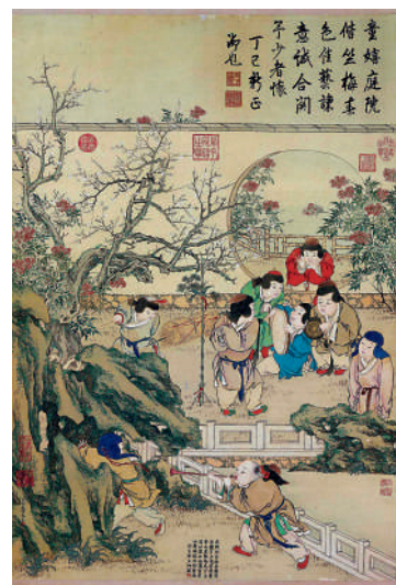
▲金廷標畫作《歲朝圖》。

不知金廷標是否遵乾隆授意做此畫，不過可以明確的是乾隆皇帝甚喜此畫，親筆為畫作題詩。「歲朝圖」這一繪畫題材，從宋代已興起，至明清盛行。「歲朝」指農曆正月初一，一年初始，人們作畫以祈福慶賀，畫中山水、花鳥和人物等皆寓意吉祥，用色亦飽滿生動，不求華麗富貴，以清新平實為佳。丁觀鵬、郎世寧等曾作《乾隆帝歲朝行樂圖》，凸顯人在自然中、人景合一的美感，唯是奉旨之作，構圖謹嚴，或少了一些金廷標此畫中熱鬧、貼地的自在樂趣。