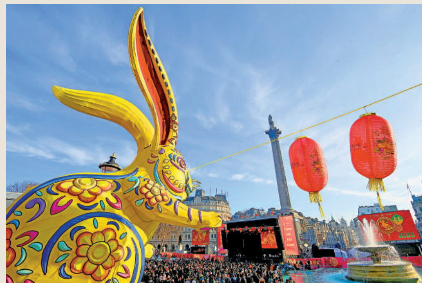
▲一月二十二日，英國倫敦特拉法加廣場上舉辦慶祝中國農曆新年活動。

雖說紅色元素在英國隨處可見，但喜慶的中國紅無疑更加迷人。除了特拉法加廣場之外，倫敦的地標建築、巨型摩天輪「倫敦眼」每逢中國春節都會亮起紅色燈光，寄託着新年願望，盼望來年幸福紅火，迄今已保持了十個年頭。按英國官方的說法，中國人重視的4H理念，即希望(Hope)、家庭(Home)、和諧(Harmony)和健康(Health)，不僅是春節傳遞的核心價值，更是世界人民產生共鳴的重要觀念，也使中國文化更加深入人心。