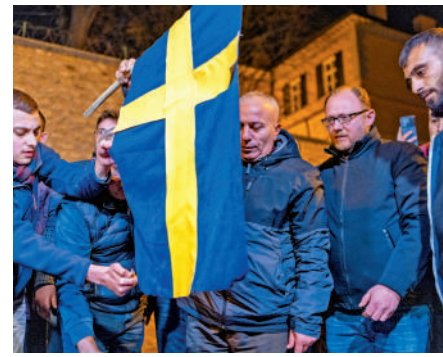
▲為抗議瑞典示威活動，土耳其人21日在伊斯坦布爾焚燒瑞典國旗。

芬蘭去年6月底簽署備忘錄，並敲定今年2月舉行三方會談，但土耳其堅持要求瑞典引渡大批「恐怖分子」，未獲滿足。