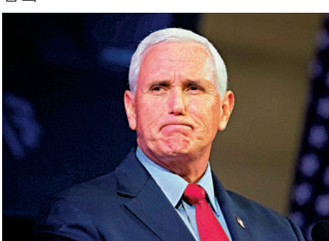
▲美國前副總統彭斯的家中也被搜出涉密文件。

可能變相助拜登與特朗普，淡化他們在私宅放置涉密文件的嚴重程度。不過，這也進一步凸顯了美國聯邦政府在儲存和保護涉密文件方面漏洞百出。