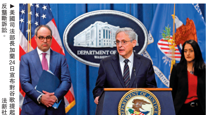
美國司法部長加蘭24日宣布對谷歌提起反壟斷訴訟。