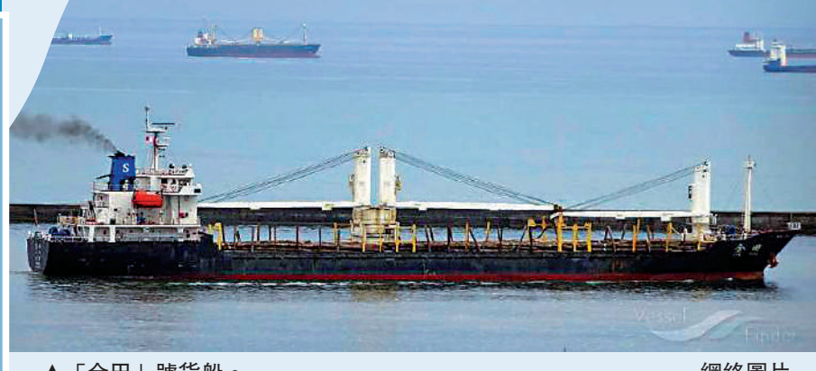
「金田」號貨船。網絡圖片