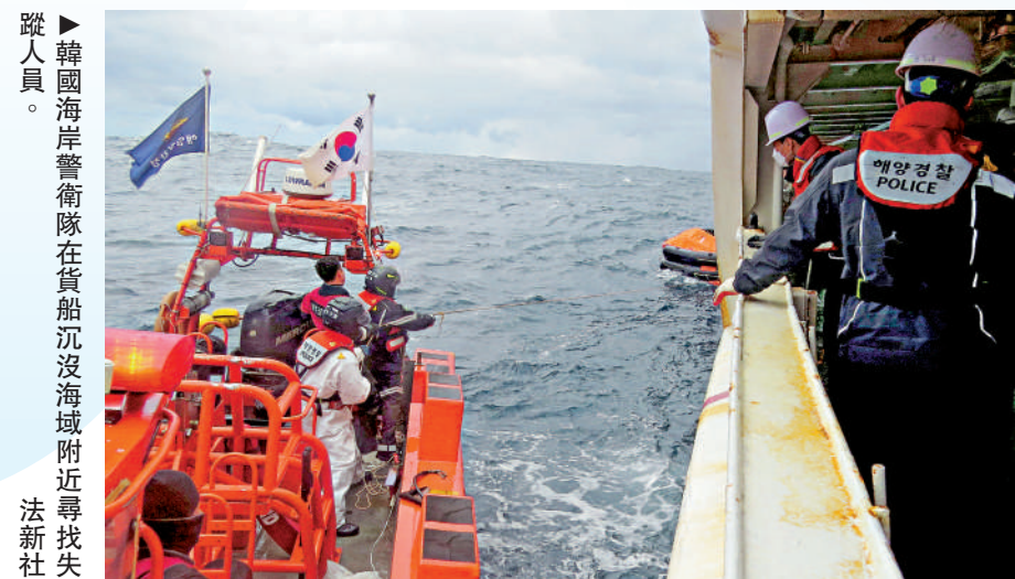
韓國海岸警衛隊在貨船沉沒海域附近尋找失蹤人員。