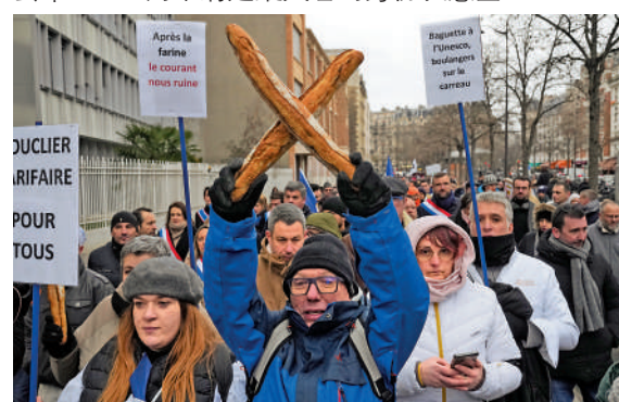
數百名麵包師23日走上巴黎街頭示威。

的火車站24日全面停擺，因為有人故意縱火焚燒電纜線，導致信號異常。目前尚不清楚縱火者的身份及意圖。