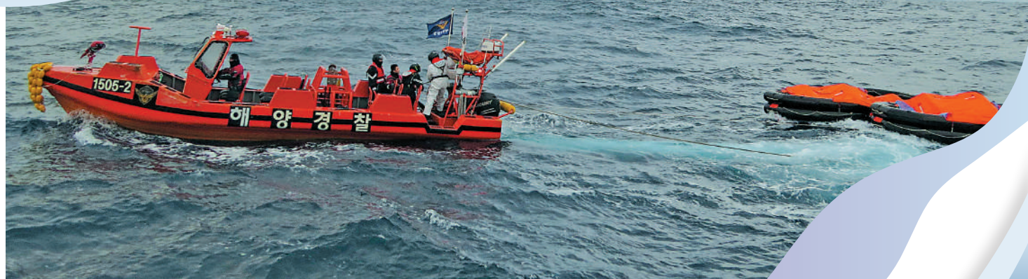
「金田」號25日沉沒後，韓國海岸警衛隊進行搜救。

據日本海上保安廳消息，「金田」號貨船在24日深夜11點15分在長崎縣男女群島以西海域航行時，發出求救信號，稱船隻正在傾斜並且進水。當地時間25日凌晨2時30分左右，船上的22名船員登上救生艇，貨船隨後沉沒。貨船同時也向韓國海警部分發出求救信號。