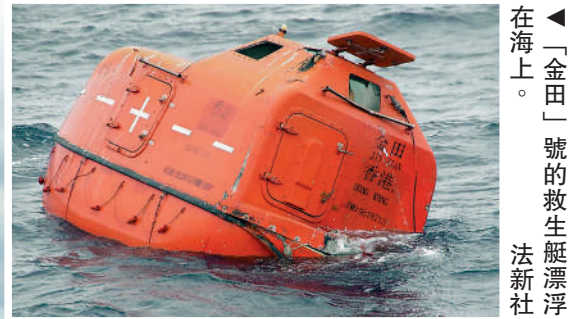
「金田」號的救生艇漂浮在海上。

【大公報訊】綜合美聯社、彭博社、新華社報道：當地時間25日凌晨，載有22人的中國香港註冊「金田」貨船在日本長崎縣對開的日韓公海海域沉沒，貨船上載有14名中國籍和8名緬甸籍船員。目前有13名船員獲救，其中2人確認死亡，6人處於心肺停止狀態，其餘9人下落不明。日韓兩國都派出救援隊進行搜救。貨船沉沒原因尚不確定，沒有與其他船隻相撞的跡象，但當時海上風浪很大。