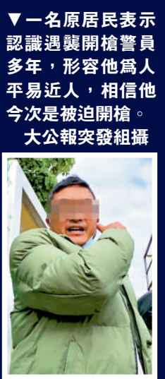
▼ 一名原居民表示認識遇襲開槍警員多年，形容他為人平易近人，相信他今次是被迫開槍。