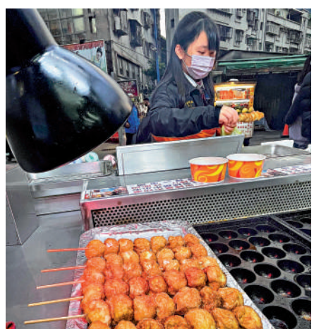
▲台灣民眾在夜市購買以鵝鶉蛋為原料的熱門小吃烤鳥蛋。網絡圖片

據統計，台灣2022年全年消費物價指數（CPI）同比上漲2.95%，創14年新高，17項重要民生物資漲幅5.02%，其中蛋類更大漲30.45%。有民代感慨，民進黨執政七年，現在百姓連吃茶葉蛋都成奢侈。