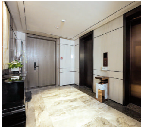
▲頤德灣尚主打兩梯兩戶設計，每戶都擁有獨立電梯廳。