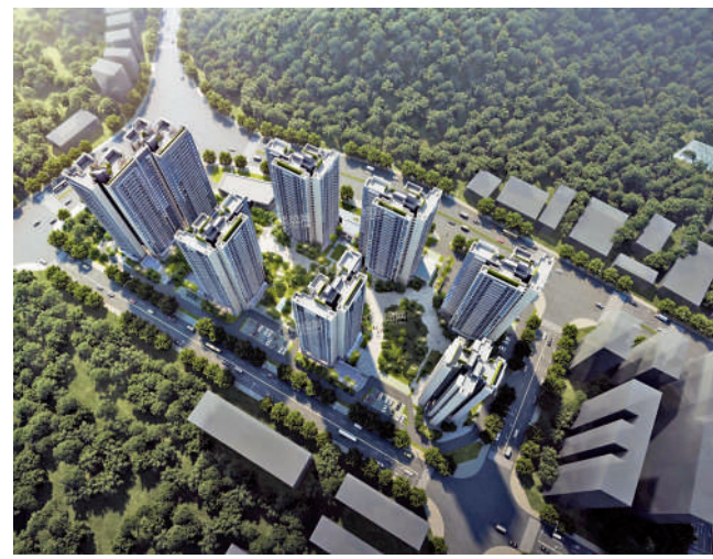
▲保利時光印象主力為建築面積約68至115平米3至4房小戶型。