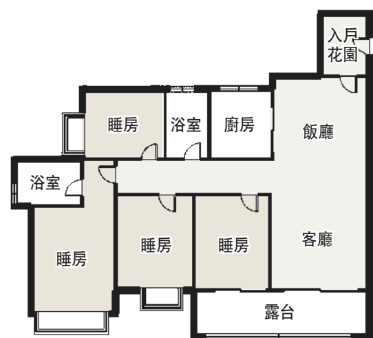
▲星河東悅灣126平米四房兩廳戶型圖。