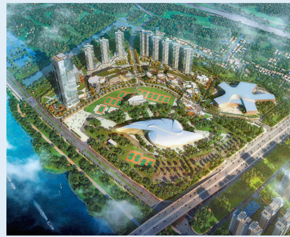
▲頤德灣尚臨海一字排開，南北對流無遮擋。

2023廣州市政府工作報告中，南沙被首次賦予新定位：打造「廣州城市新核心區」。頤德灣尚位於蕉門河板塊與明珠灣板塊的交界處，其所在的明珠灣起步區對外交通將形成「15、30、60」交通圈，即15分鐘車程到交通樞紐：慶盛站，乘坐廣深港高鐵路30分鐘即可直達香港西九龍；連接廣澳、廣深沿江等高速公路，深中通道、港珠澳大橋等交通要道，30分鐘可抵深圳，60分鐘到達中山、珠海、澳門等大灣區核心城市；鄰近規劃中的地鐵15號線體育館站，2站可接駁地鐵18號線及22號線，30分鐘即達廣州天河。