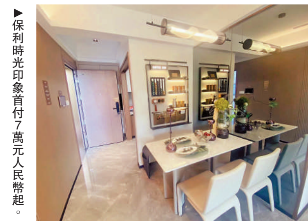
▲保利時光印象首付7萬元人民幣起。