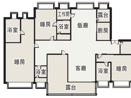
▲頤德灣尚200平米三房兩廳戶型。