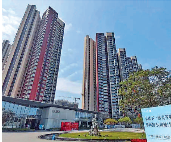
▲星河東悅灣配套成熟，價格較同區樓盤偏高。