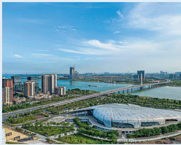
▲頤德灣尚定位高端豪宅，戶戶南向，視野開闊。