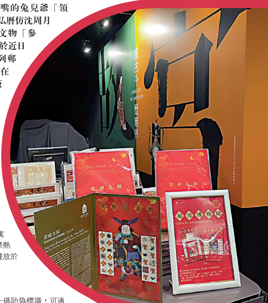
▲第一批400版賀歲郵票已運抵香港故宮文化博物館。