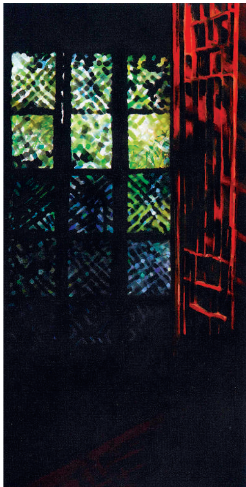
▲益行為今次展覽創作《記憶之窗》。

展期：即日起至1月31日 地點：香港中央圖書館展覽廳1-5號廳 時間：1月29、30日上午9點至晚上8點 1月31日上午9點至下午3點 費用：免費