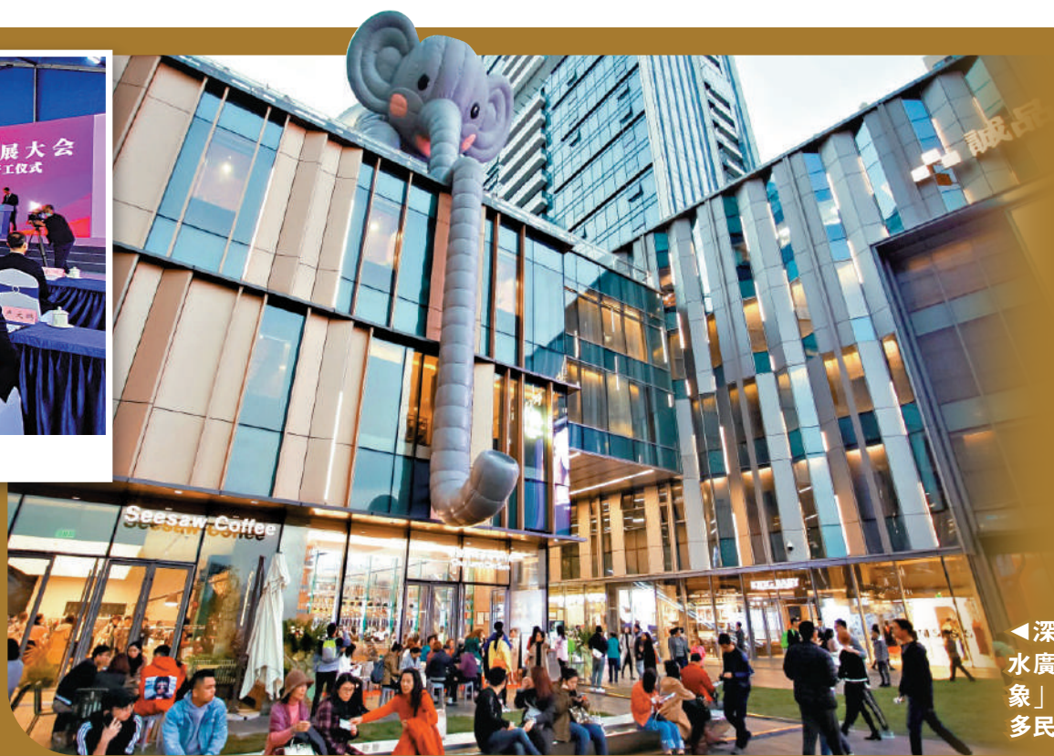
▲深圳萬象天地水廣場的「抱抱象」裝置引來眾多民眾打卡。