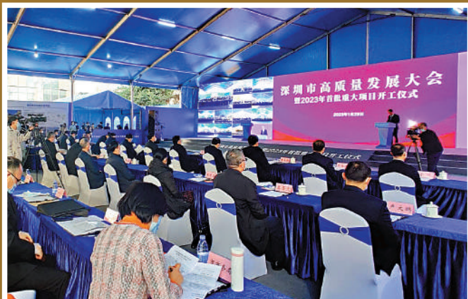
▲1月29日，深圳市高質量發展大會會議現場。