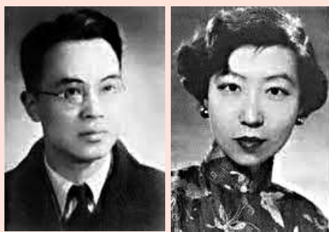
▲1944年胡蘭成給張愛玲婚書上寫了一句說話：「歲月靜好，現世安穩」，典出《詩經·鄭風·女曰雞鳴》。

體現了《詩經》緊貼現實，語言純樸，不尚雕琢而渾然天成的文學特色，帶有強烈的民生氣息和濃郁的鄉土情調，是淳樸生命和自然情感的真摯流露。